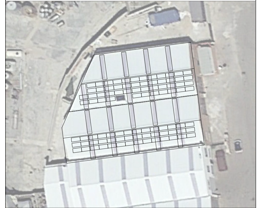
Módulo Solar SUNTECH STP340 - 24/Vfw