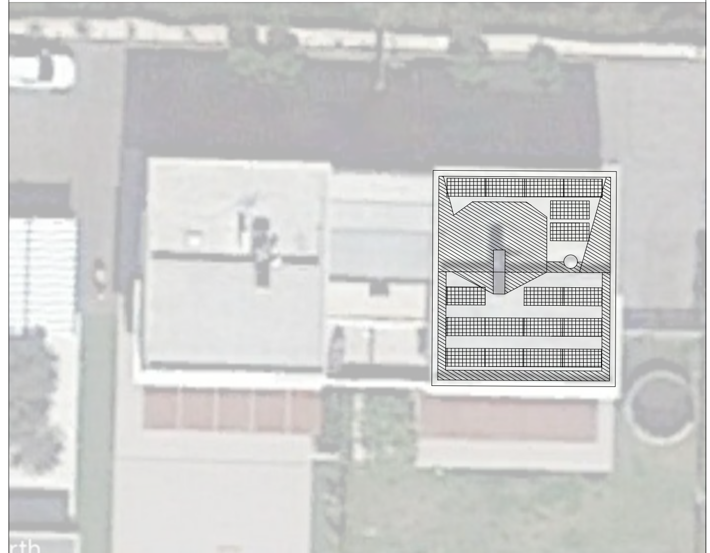
Módulo Solar SUNTECHNICS STM340 - 24/Vfw